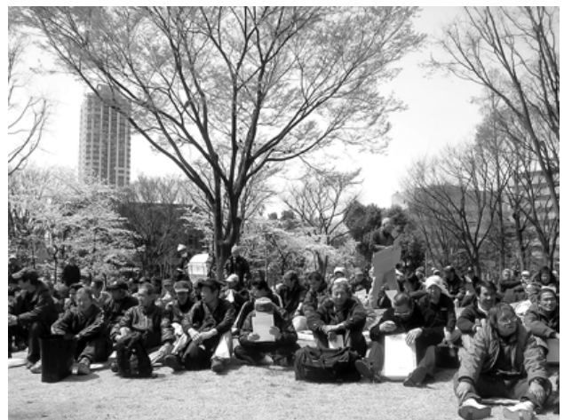
2006年4月「花見の会」中央公園にて200名も参加