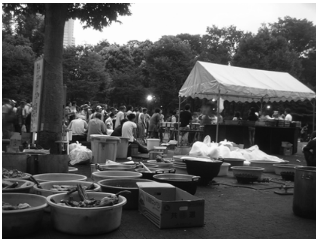
2006年第13回新宿夏まつり炊き出し風景。中央公園にて

2000年以降、多くの財政と施策を動員し、その実施部隊として経験ある社会福祉法人やNPO法人の協力を取り付けてもまだ東京の「ホームレス問題」が、概数的には（可視的にも）暫減してはいるものの、「解消」したとは決して云えぬ水準を維持し、また施策内容上も、第2種宿泊施設を筆頭とした「中間施設」への滞留、「中間施設」～「路上」の循環が構造化し、居宅＝地域社会への復帰があまり進んでいない点こそ冷静に分析し、次なる展開を準備していく基本とすべきなのだろう。