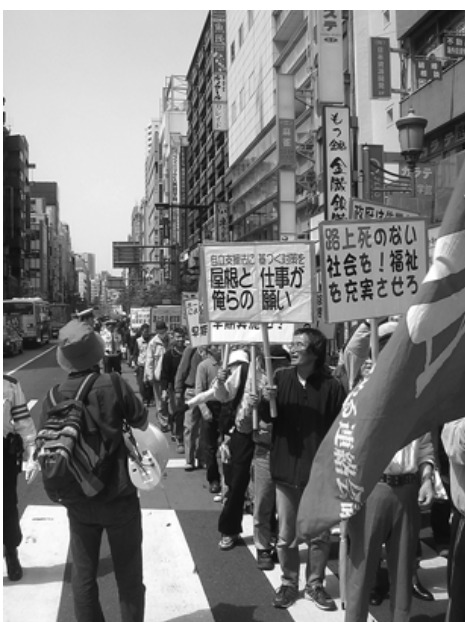
2006年第12回新宿メーデー。今年もやりました。

「新宿と云えばホームレス、ホームレスと云えば新宿」なる「迷言」を枕詞にすると区行政の方々は眉をひそめてしまうのであるが、1980年代後半、都庁が西新宿に移転した頃から、90年代初頭にか